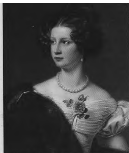
Амалия Крюденер, первая любовь поэта. Художник И. Штилер. 1828 г.

Я очи знал, — о, эти очи! Как я любил их — знает бог!