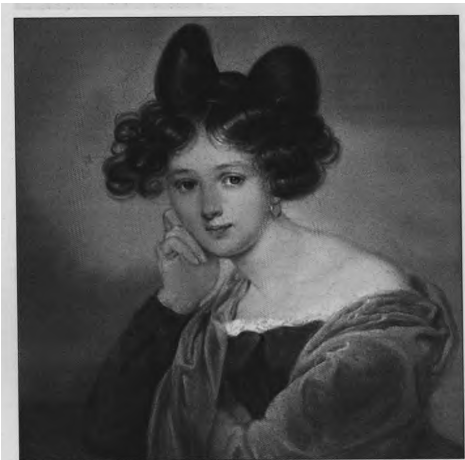
Элеонора Тютчева, первая жена поэта. Неизвестный художник. 1830-е гг.

От их волшебной, страстной ночи Я душу оторвать не мог.